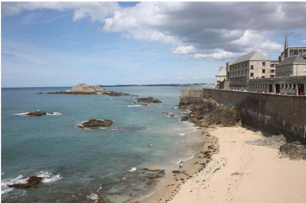
Figura 15: Saint-Malo