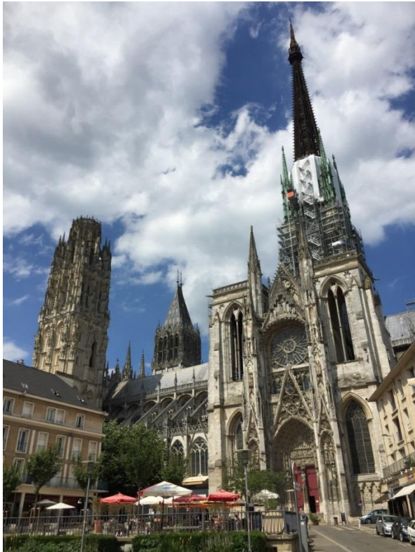
Figura 4: cattedrale di Rouen

Primo spuntino (si fa per dire) nei ristorantini locali molto graziosi e finalmente si parte alla volta di Rouen. Qui comincia l'avventura della visita alle varie cattedrali (Notre Dame a Rouen e Sainte Etienne a Caen) in stile gotico normanno con caratteristiche torri in facciata e centinaia di guglie e pinnacoli. Vengono sempre in mente i quadri di Monet che ha dipinto la facciata della cattedrale di Rouen 50 volte, con una luce sempre diversa.