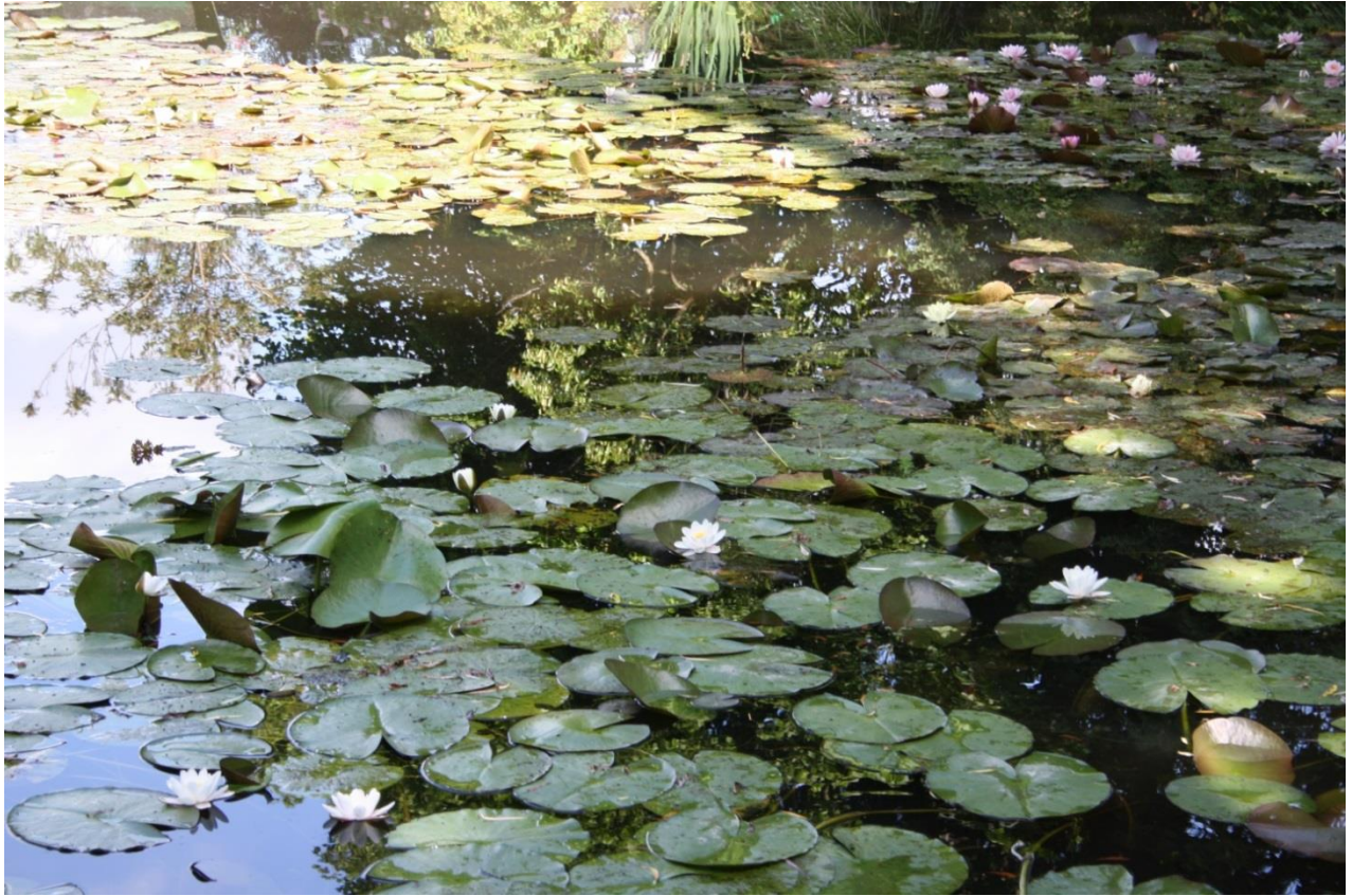
Figura 2: ninfee