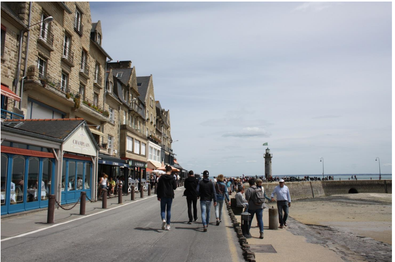
Figura 187: Cancale