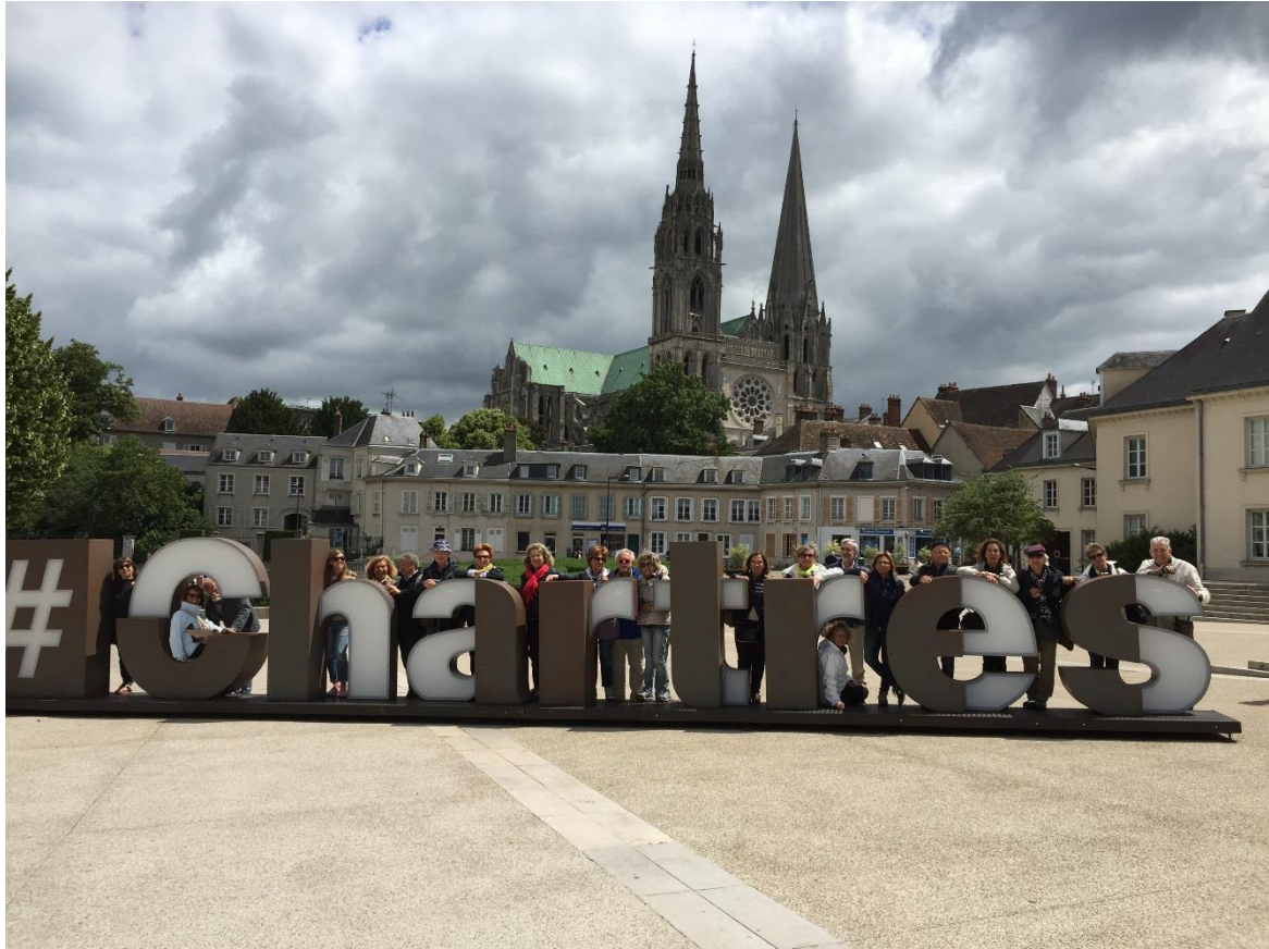
Figura 11: cattedrale di Chartres