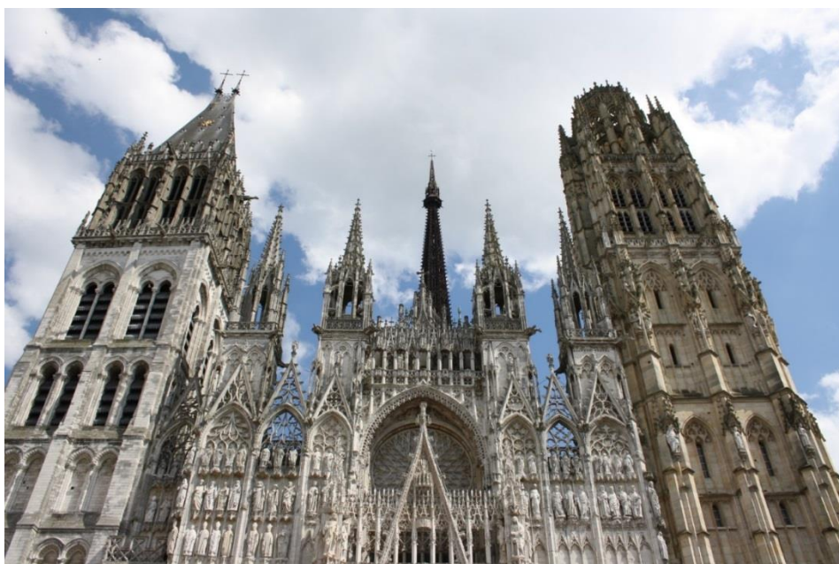
Figura 6: cattedrale di Rouen