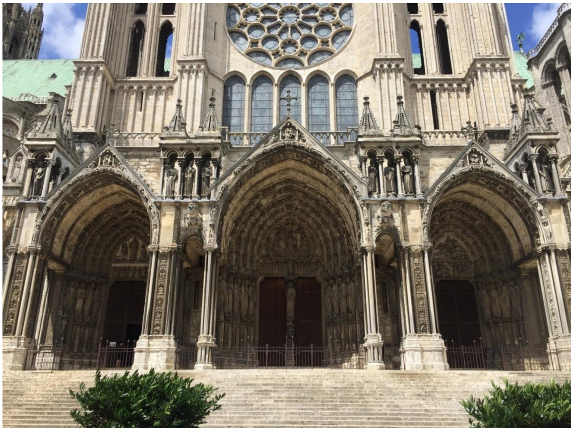
Figura 3312: cattedrale di Chartres