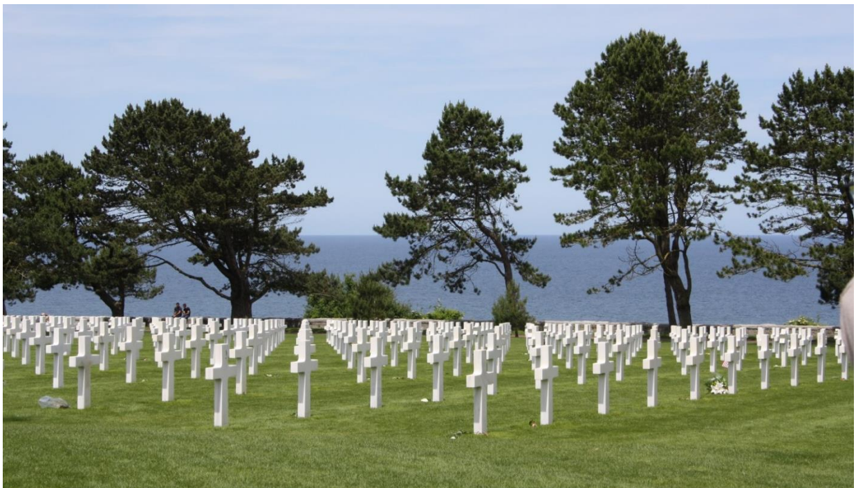
Figura 3: cimitero americano di Omaha Beach