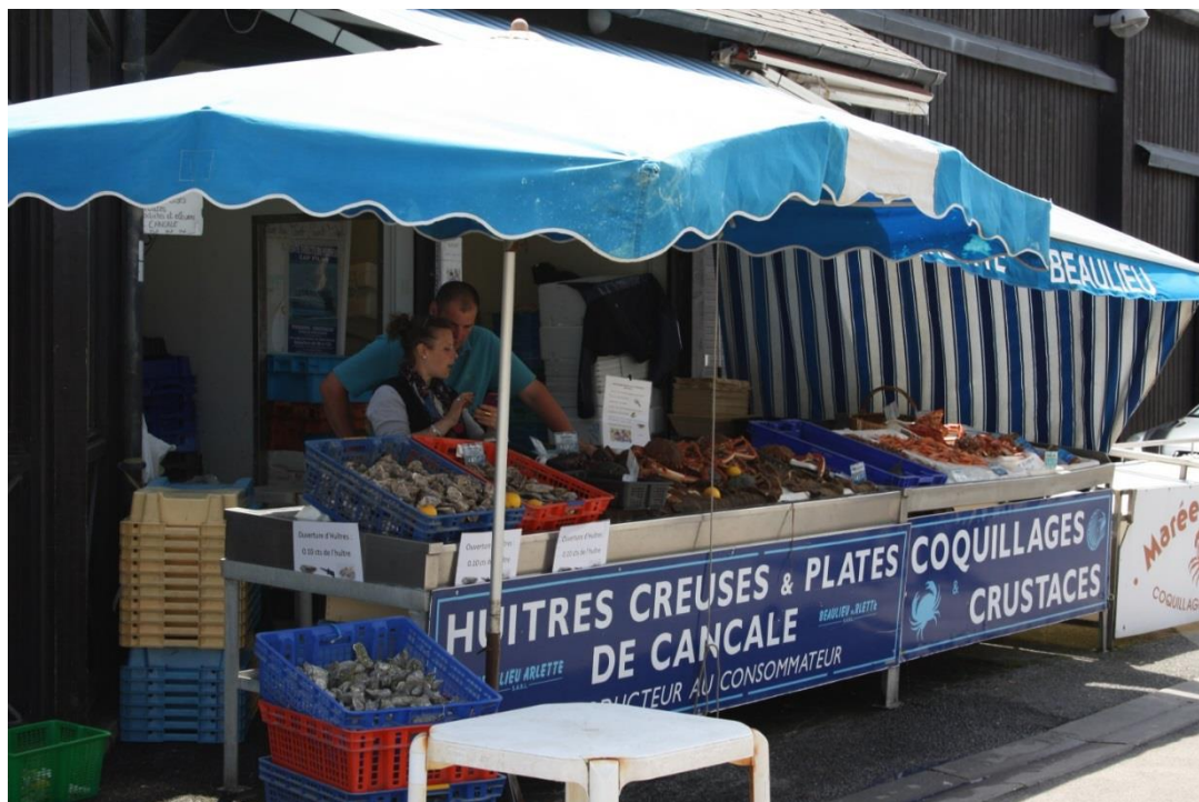
Figura19: le famose ostriche di Cancale

Partiamo da Saint-Malo la mattina del 5 giugno, costeggiamo la diga di Rance (barrage de Rance), diga che produce elettricità sfruttando le maree. Da qui lasciamo la Normandia e, attraversando pascoli verdeggianti popolati di mucche, fuori programma, raggiungiamo Cap Fréhel, uno dei luoghi più suggestivi della Bretagna, senza nulla togliere alle falesie di Etretat.