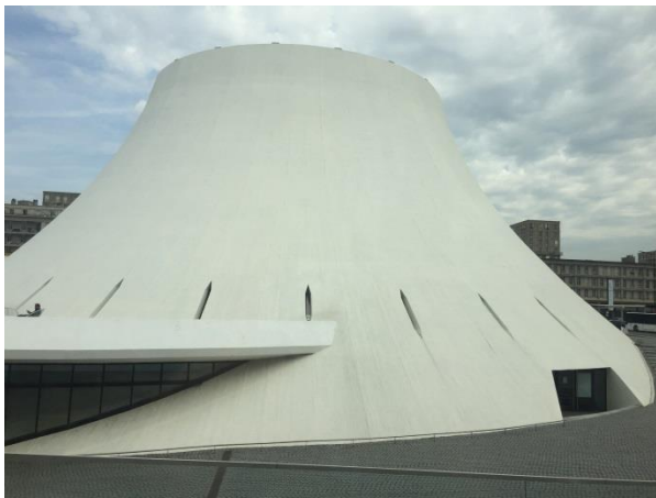
Figura 7: Le Volcan di Oscar Niemeyer a Le Havre