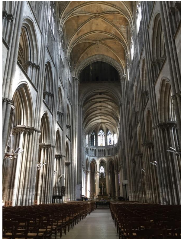
Figura 5: interno cattedrale