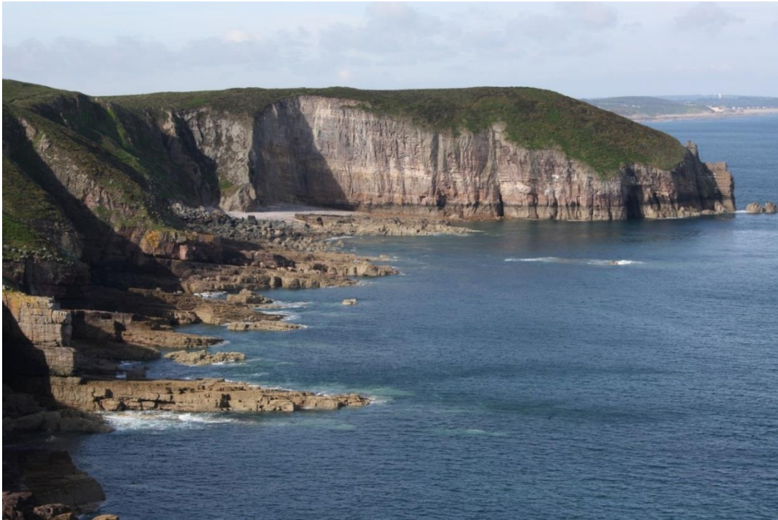
Figura21: Cap Fréhel

Ma qui le rocce che si protendono verso la Manica sono costituite da scisto e gneiss rosa. Siamo nella "Corniche Bretonne" costellata di spiagge rocciose di granito rosa e sostiamo in alcuni di questi paesi come Perros-Guirec, Trégastel.