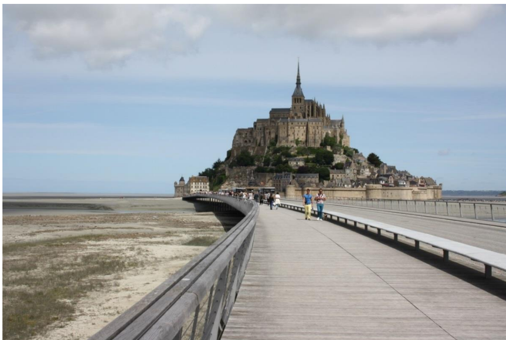
Figura 13: Mont Saint Michel

Il giorno successivo visitiamo l'abbazia di Mont Saint Michel. Siamo in bassa marea, attraversiamo tranquillamente il ponte di recente realizzazione, progettato dall'architetto austriaco Dietmar Feichtinger; è lungo circa 800 metri ed è sostenuto da 134 pali.