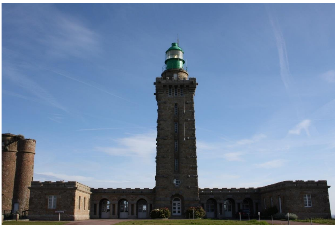
Figura20: faro di Cap Fréhel

Partiamo da Saint-Malo la mattina del 5 giugno, costeggiamo la diga di Rance (barrage de Rance), diga che produce elettricità sfruttando le maree. Da qui lasciamo la Normandia e, attraversando pascoli verdeggianti popolati di mucche, fuori programma, raggiungiamo Cap Fréhel, uno dei luoghi più suggestivi della Bretagna, senza nulla togliere alle falesie di Etretat.