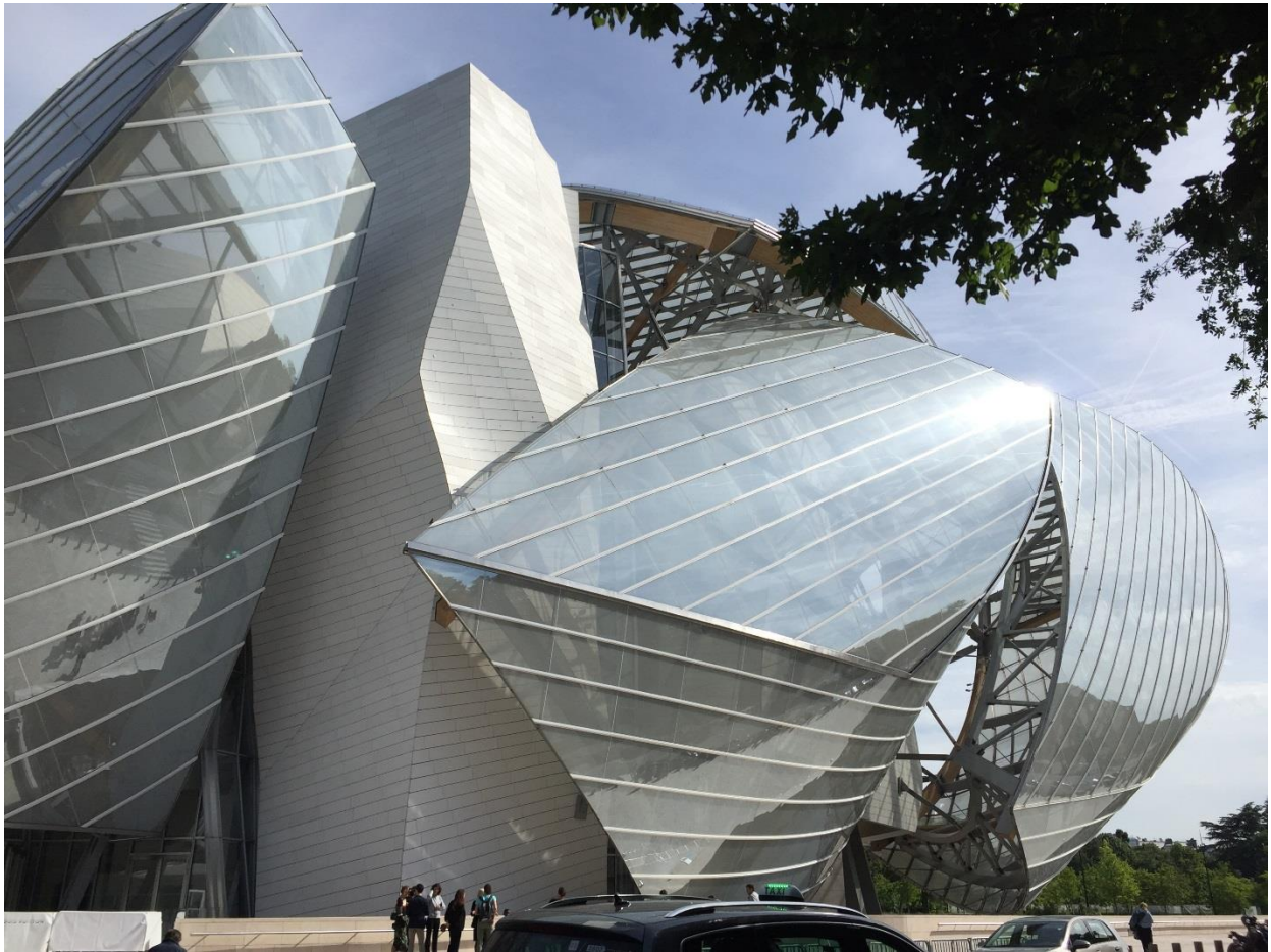
Figura 145: Fondazione Luis Vitton

Il mattino dell'8 giugno abbiamo tempo di visitare liberamente qualche luogo, piazza, parco o museo. Qualcuno riesce a vedere e qualche altro anche a visitare la Fondazione Luis Vuitton, recentissimo edificio progettato da Frank Gehry.