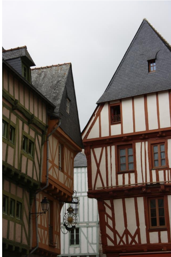
Figura 30: case a graticcio Vannes