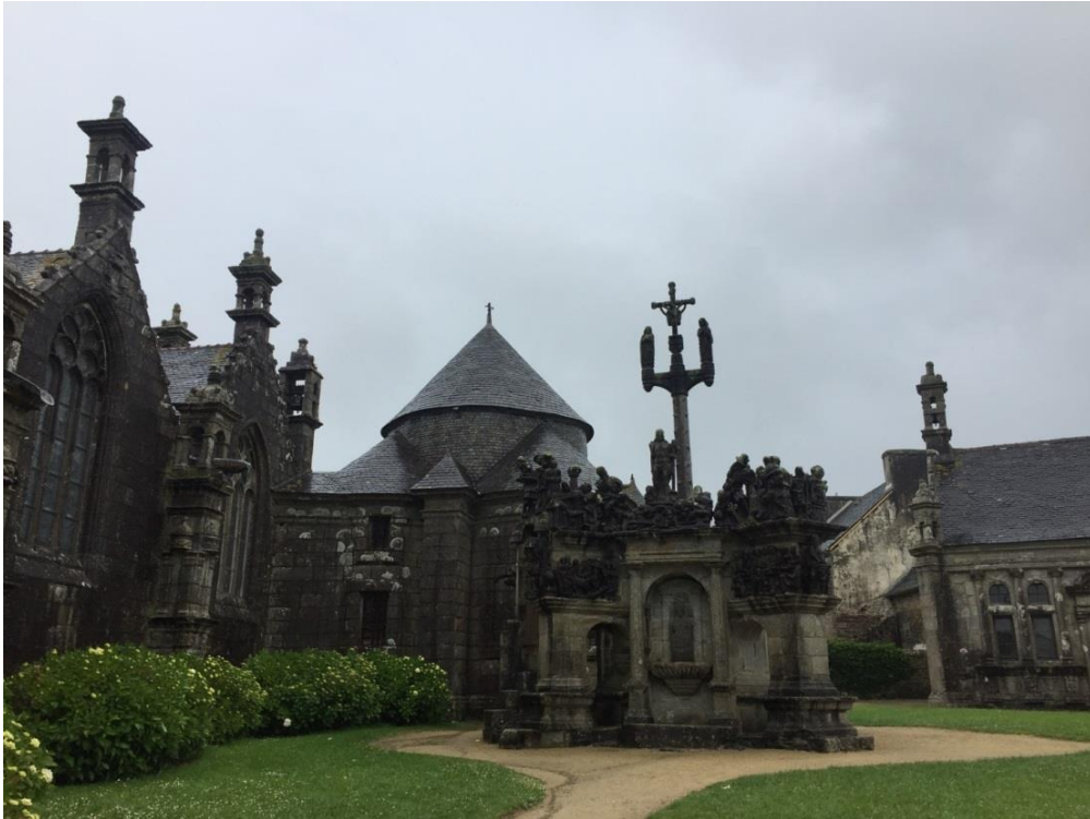
Figura 23: Calvario di Guimiliau

Nel pomeriggio si raggiungono paesaggi più cupi dei "Calvari", resi più tristi e grigi da una pioggia battente e vento impertinente che ci impediscono di fotografare e apprezzare come meriterebbe, il particolare villaggio di Locronan.