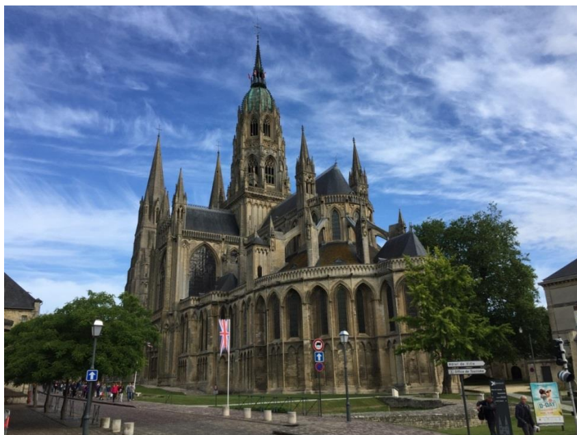
Figura 8: cattedrale di Bayeux

Nel frattempo ci venivano illustrate le vicende storiche di Guglielmo il conquistatore, vicende che abbiamo potuto rivivere leggendo il magnifico arazzo di Bayeux e visitando a Caen il castello residenza del sovrano.