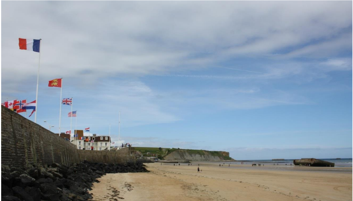
Figura 92: spiaggia di Arromanches les Bains

Dopo Caen, un tuffo nel più recente ma drammatico passato, lo abbiamo vissuto nel ripercorre i luoghi ben più tristi e famosi dello sbarco alleato nelle spiagge di Normandia. Silenzi, emozioni, riflessioni di fronte al cimitero di guerra americano, ai bunker, alle immense buche lasciate dai bombardamenti.