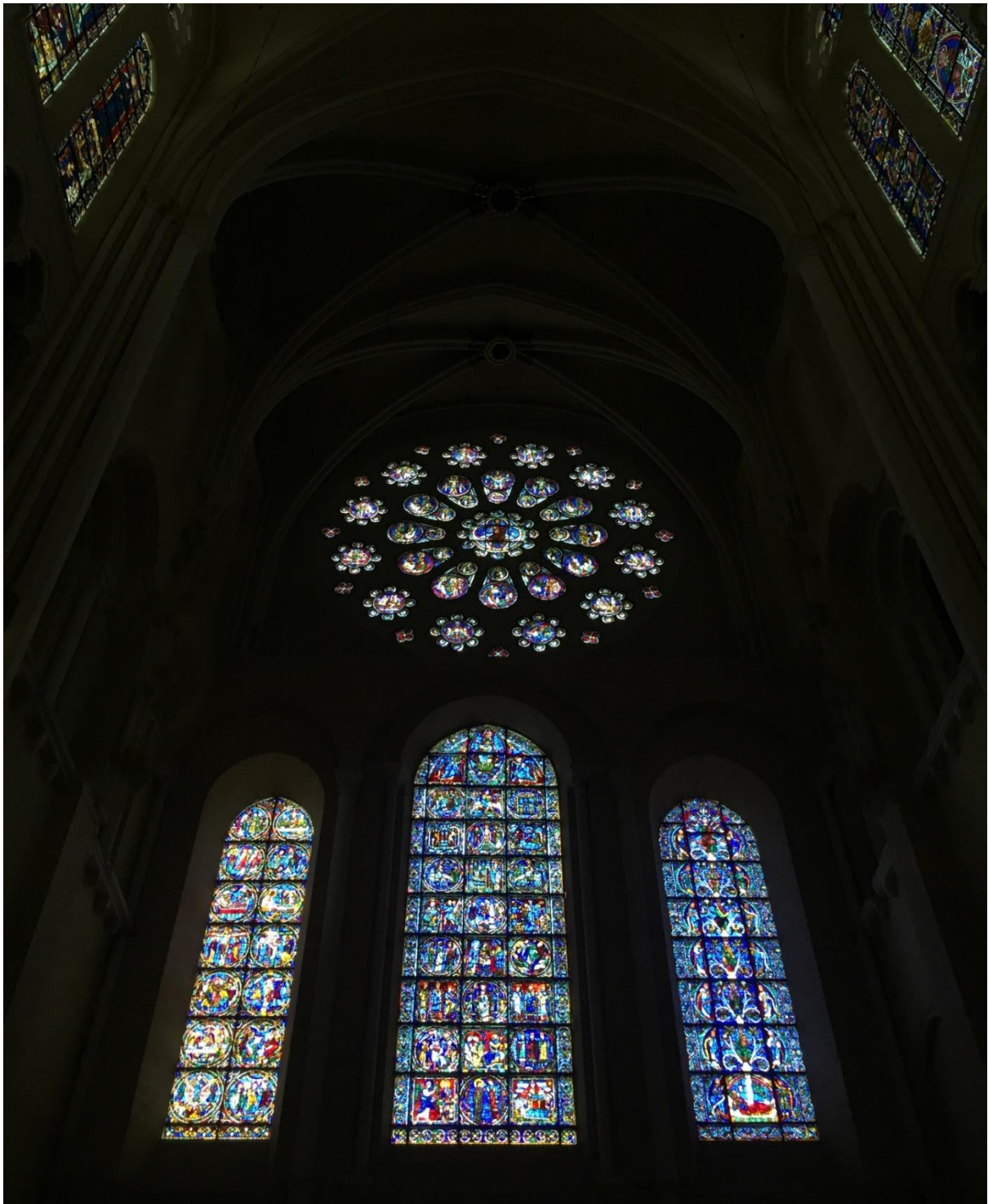
Figura 134: vetrate cattedrale di Chartres

Siamo arrivati alla fine del viaggio; in serata si rientra a Parigi per l'ultimo pernottamento. Percorriamo in pullman le zone monumentali più caratteristiche della ville. Dopo cena passeggiamo per Montmartre fino a scendere al Moulin Rouge.