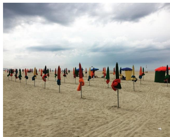
Figura 8: spiaggia di Deauville

Nel frattempo ci venivano illustrate le vicende storiche di Guglielmo il conquistatore, vicende che abbiamo potuto rivivere leggendo il magnifico arazzo di Bayeux e visitando a Caen il castello residenza del sovrano.