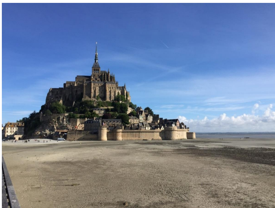
Figura14: Mont Saint Michel