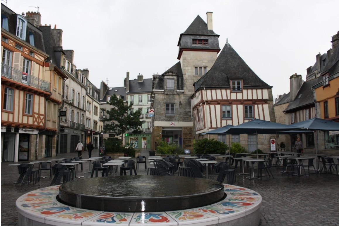
Figura 25: Quimper

Si passa poi a Quimper, nella Cornovaglia francese dove visitiamo ancora una cattedrale gotica, quella di S. Corentin, poi ancora sulla costa a Concarneau con la sua "ville close" nel Finistere. Siamo proprio giunti alla fine delle terre.