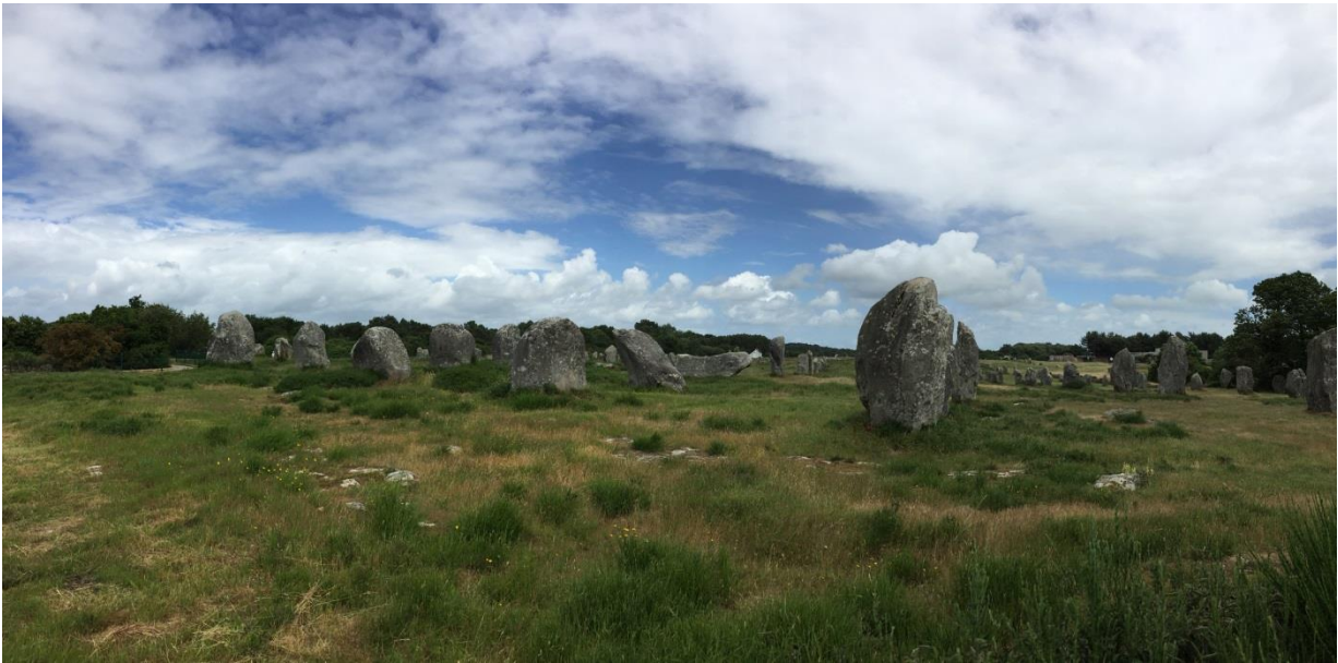
Figura 289: Carnac

Improvvisamente, dopo tanto gotico, un tuffo nel lontanissimo Neolitico: visitiamo gli "allineamenti" di Carnac con i 2792 menhir, disposti in 10 file. Emozioni, riflessioni sui nostri antenati!