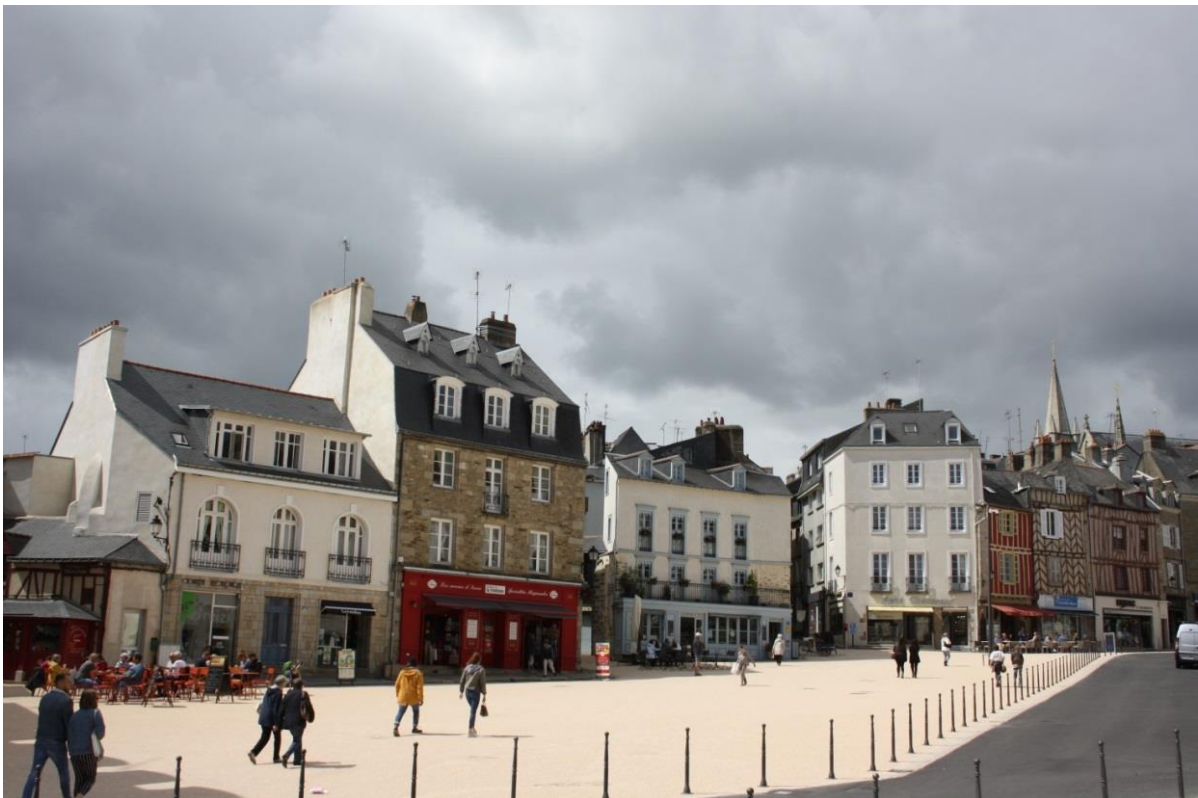
Figura 2910: Vannes

Si torna comunque repentinamente alla civiltà più recente, per arrivare a Vannes, carinissima città medievale, cinta da alte mura, con caratteristiche case a graticcio, piazzette singolari e ancora una cattedrale gotica.