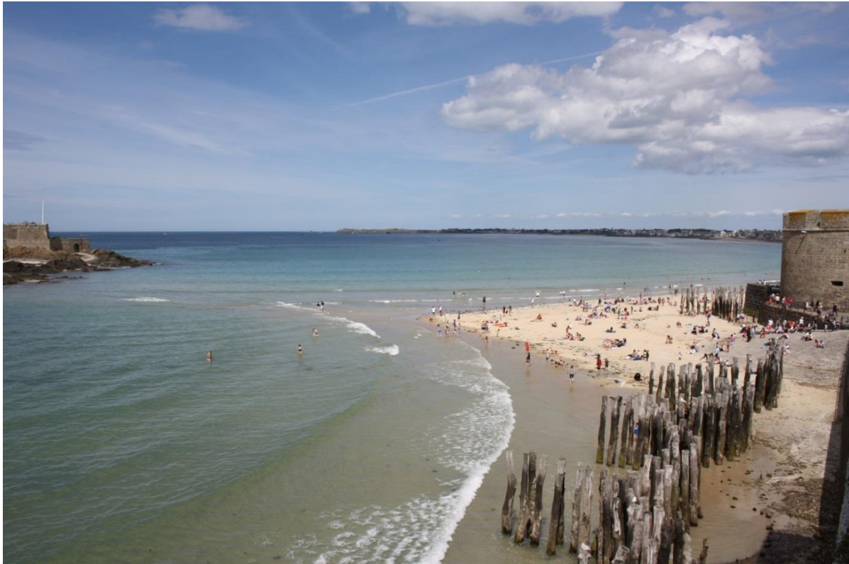
Figura 4: Saint-Malo

Finalmente si dorme per 2 notti di seguito nello stesso albergo a Saint-Malo, dove alcuni di noi passeggiano la sera entro la città chiusa per ammirare alle 22 un indimenticabile tramonto dietro isolotti rocciosi.