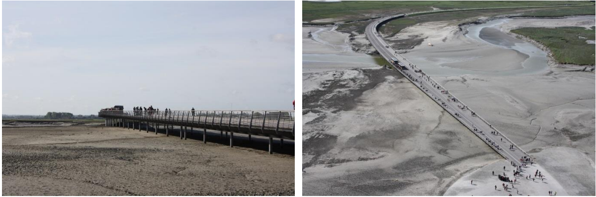
Figure 6 ponte dell'Arch. Dietmar Feichtinger

Visitiamo l'abbazia voluta, secondo la leggenda, dall'arcangelo Michele che ordinò al vescovo Auberto di erigere questa chiesa nella roccia.