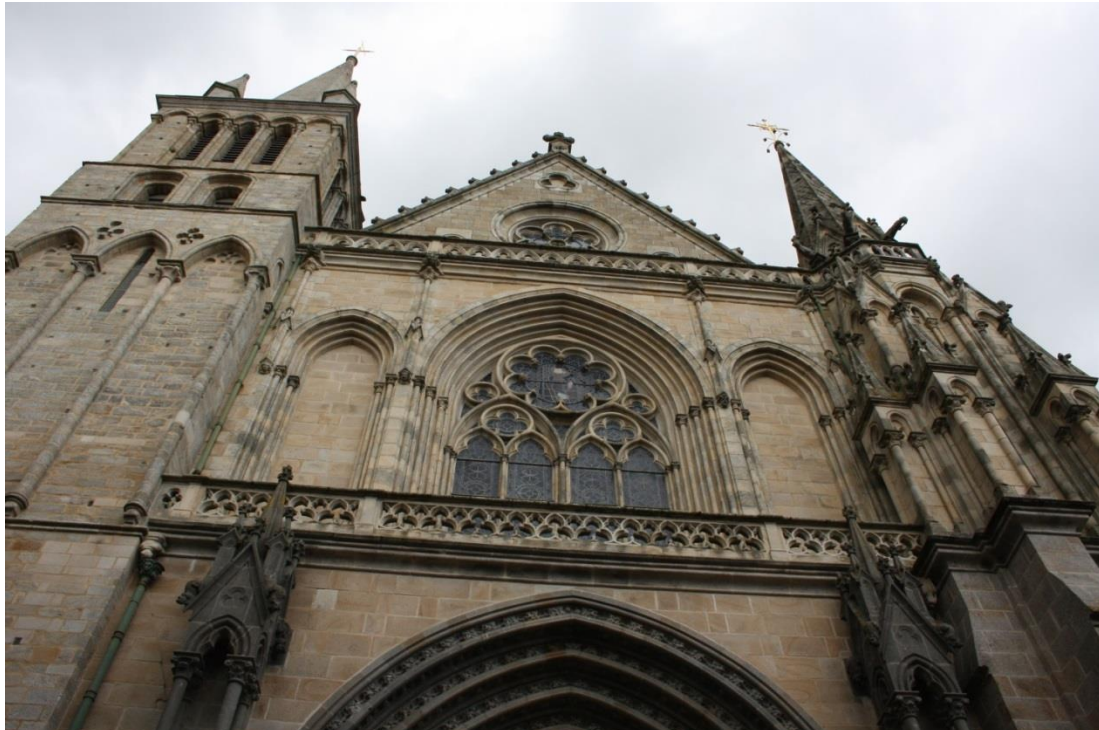
Figura 31: cattedrale di Vannes

Il mattino successivo invece di recarci a Rennes, ci spostiamo direttamente a Chartres, dove si rimane letteralmente incantati dall'imponenza della cattedrale, dalla sua facciata e all'interno dalle favolose variopinte vetrate.