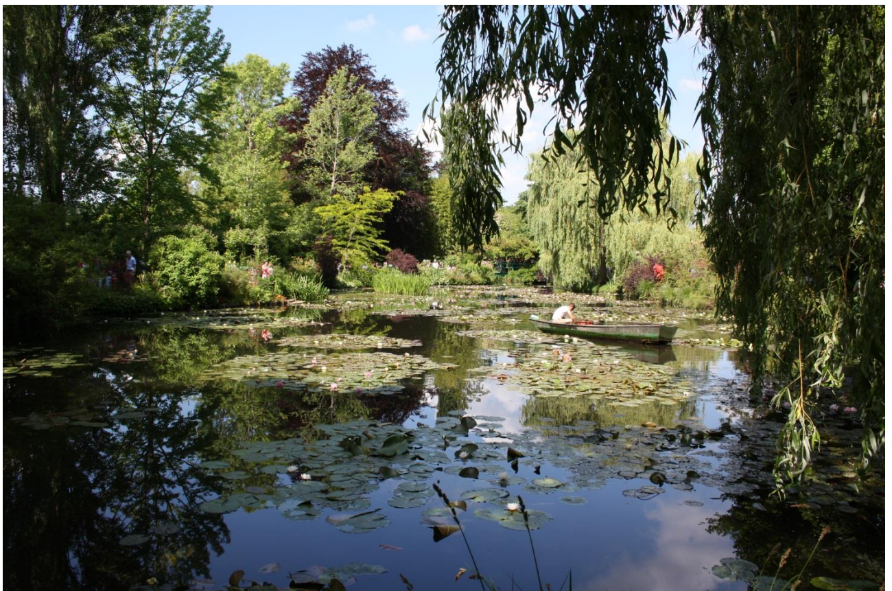
Figura 1: giardino di Monet