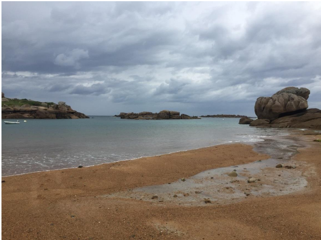
Figura 8: spiaggia di Trégastel

Ma qui le rocce che si protendono verso la Manica sono costituite da scisto e gneiss rosa. Siamo nella "Corniche Bretonne" costellata di spiagge rocciose di granito rosa e sostiamo in alcuni di questi paesi come Perros-Guirec, Trégastel.