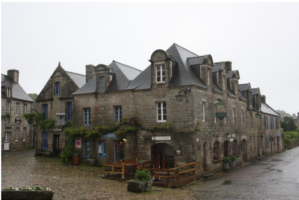
Figura 24: Locronan