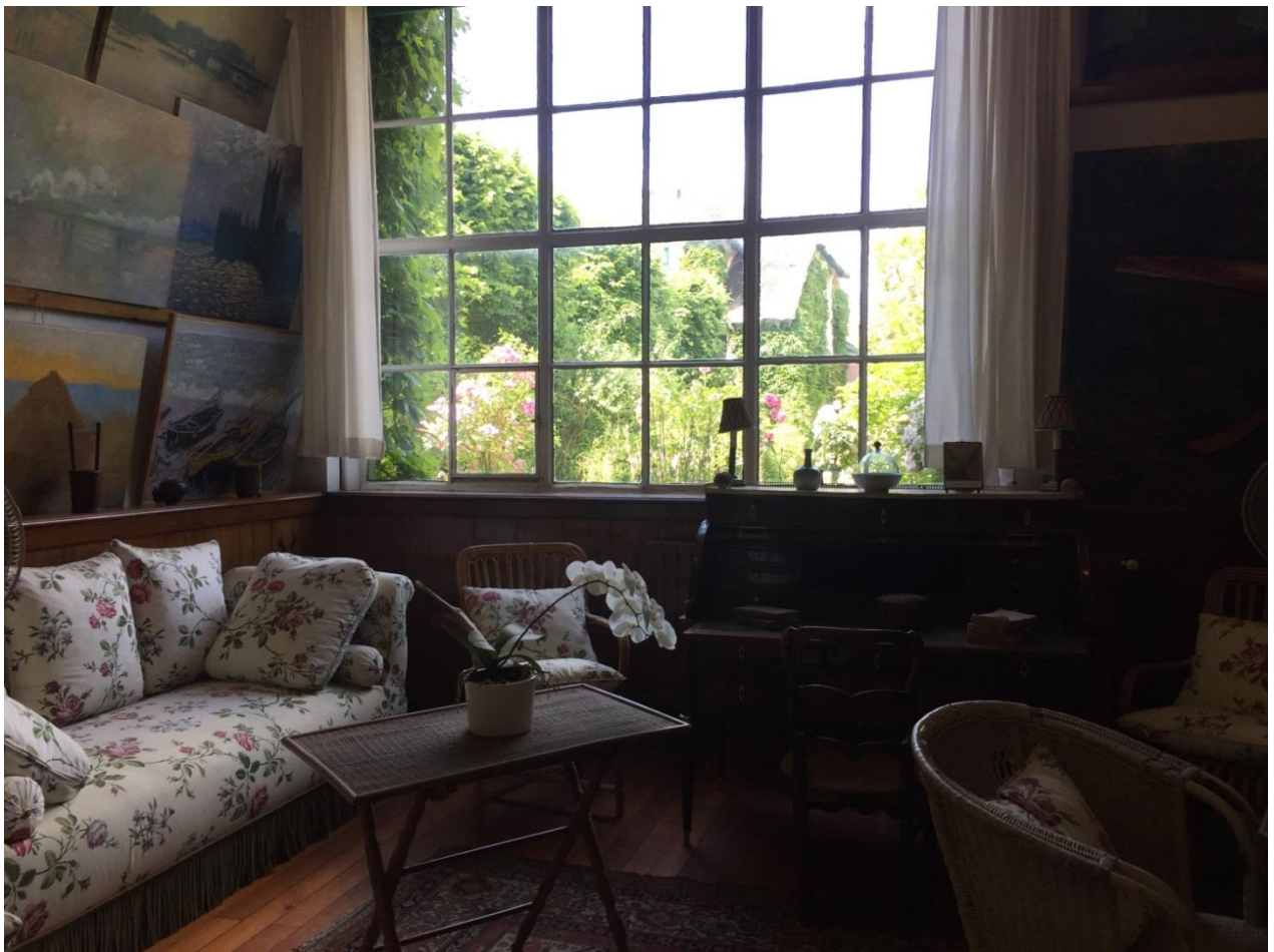
Figura 3: interni casa